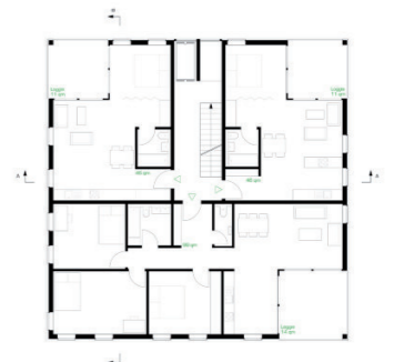
Grundriss 1.OG, M 1:1000